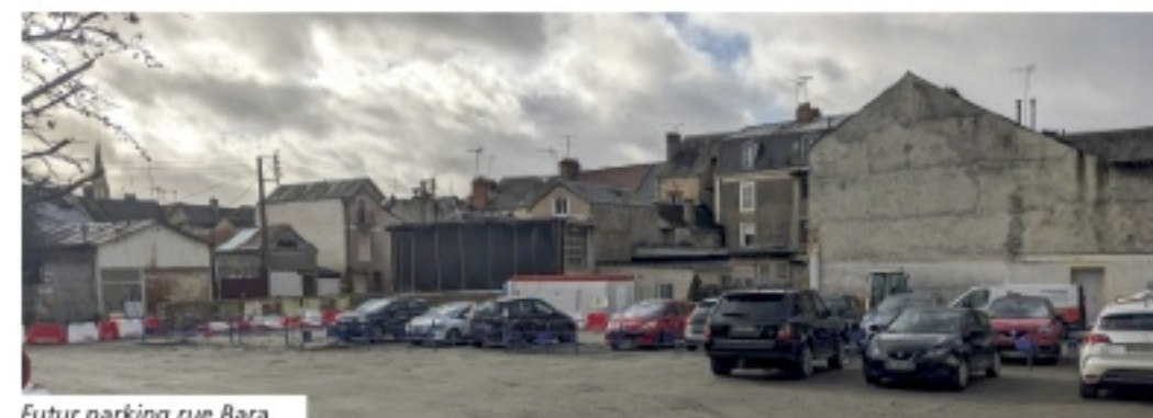
Futur parking rue Bara.