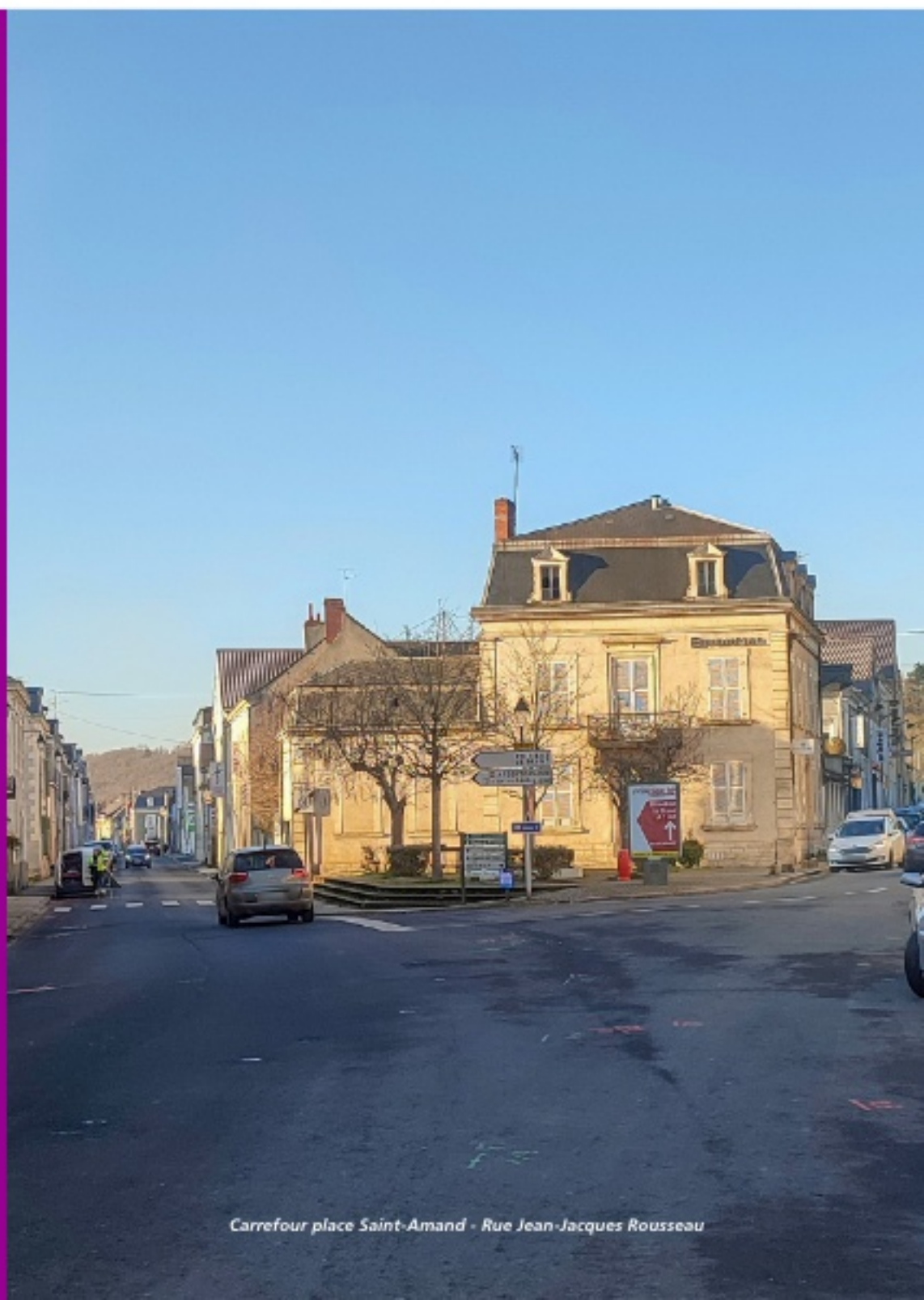
Carrefour place Saint-Amand - Rue Jean-Jacques Rousseau

2024: obligation du tri à la source des biodéchets