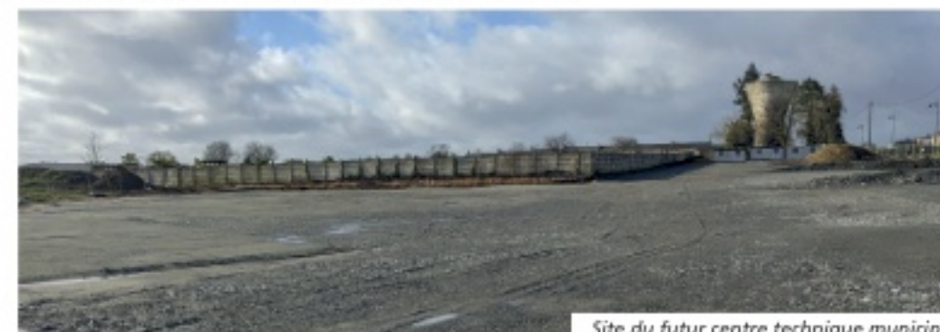
Site du futur centre technique municipal.

Pour mener à bien ces projets structurants, la municipalité est accompagnée par ses partenaires institutionnels, à savoir l'Etat, la région Centre-Val de Loire, le département de l'Indre et l'Agence de l'Eau Loire-Bretagne.